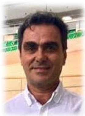
José Luiz Vasconcellos Presidente Confederación Brasileña de Ciclismo

Será un gran placer recibirlos en estas dos etapas de la Copa Latinoamericana de BMX, ya que seremos anfitriones de una de las carreras más involucradas y disputadas de América, donde siempre primará la amistad y el espíritu deportivo.